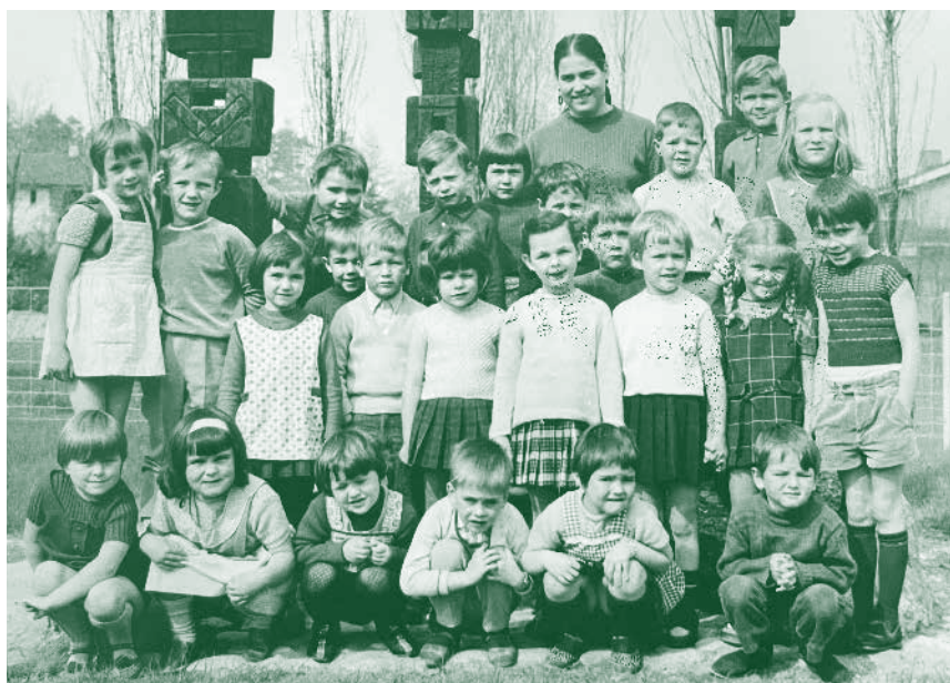
Als Kindergärtnerin mit ihrer Klasse (oben).