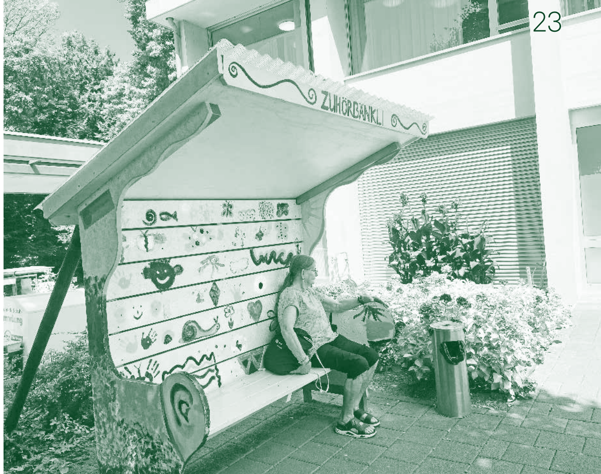
Das «Zuhörbänkli» beim Hochhaus auf dem Areal des Lindenhofspitals.

Städten und Dörfern die Kirchenglocken geläutet. Und als der Krieg fertig war, haben die Glocken wieder geläutet, und da hätte jede Familie hier zwei bis drei Männer verloren. Und ja, die Einschusslöcher an der Hausmauer unseres Nachbarn wurden von deutschen Soldaten verursacht, als sie im zweiten Weltkrieg auf der Suche nach Partisanen das Dorf durchsucht hätten. Nein, gefasst hätten sie niemanden, der Vorteil der Partisanen war, dass sie jeden Geheimgang und jedes Versteck kannten.